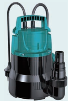
Per acqua pulita | Clean Water