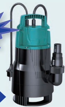
COMBINATA Dirty & Clean Water

Piede richiudibile che permette di trasformare la pompa da acque cariche ad acque chiare.