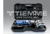
Pressatrice a batteria Battery crimping machine