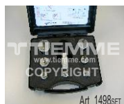
Valigetta con set calibratori/sbavatori Ø14-Ø40 Box with deburring tools set Ø14-Ø40